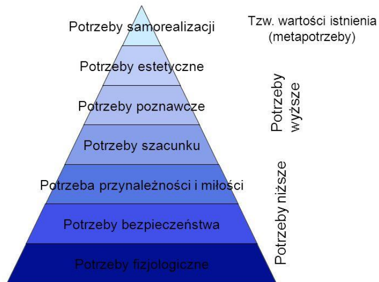
Hierarchia potrzeb wg A. H. Masłowa

Motywacja to ogólny termin odnoszący się do wszystkich procesów związanych z rozpoczynaniem, kierowaniem i podtrzymywaniem działań. Niektóre formy motywacji wydają się bardzo podstawowe np. jeśli odczuwam głód, to sięgam po jedzenie; jeśli mam gorączkę, idę do lekarza; jeśli chcę wygrać zawody pływackie, regularnie ćwiczę. Wyniki wielu eksperymentów dowodzą (Zimbardo, 2009), że zachowanie jest motywowane przez popędy wewnętrzne (biologiczne jak np. głód) i zewnętrzne (podniety, nagrody). U podstaw naszych zachowań leży kombinacja wewnętrznych i zewnętrznych źródeł motywacji. Najlepiej ilustruje to zagadnienie hierarchia potrzeb humanistycznego psychologa Abrahama Maslow`a: